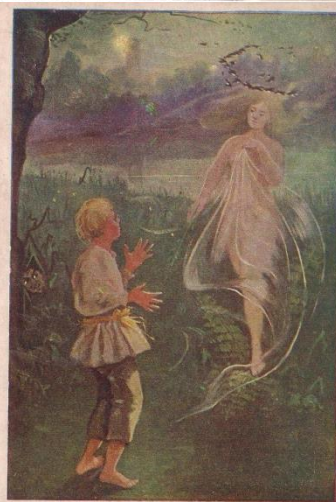
Ach, cóż to za panna! Ma twarz, nogi, zółtydek — lecz coś niby szklana. Co za dziwne stworzenie z myśli i dołzety! Juliusz Słowacki „Balladya” (Ciebie, Gopłana)